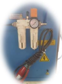
Profesjonalny zespół przygotowania powietrza (filtrreduktor + smarownica)