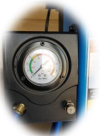
System pompowania koła za pomocą pedału nożnego

TC562B to automatyczna montażownica do kół samochodów osobowych i dostawczych. W standardzie wyposażona jest w przystawkę Technoroller do opon nisko-profilowych i Run-Flat. Posiada duży stół roboczy do felg o średnicy do 24" oraz dwie prędkości obrotowe stołu roboczego.