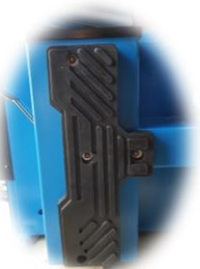
Profesjonalna guma ochronna zbijaka