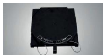
* opcjonalne obrotnice