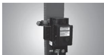
* pneumatyczny system sterowania blokadami