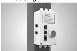
* panel serowania napięciem bezpiecznym 24V