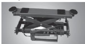
* opcjonalny podnośnik osi 2800 kg

Podnośnik L440.46A to 4-kolumnowy podnośnik diagnostyczny zaprojektowany do kontroli i korekty ustawień geometrii pojazdów. Wyposażony jest w zagłębienia pod obrotnice oraz tylne płyty luzujące zawieszenie.